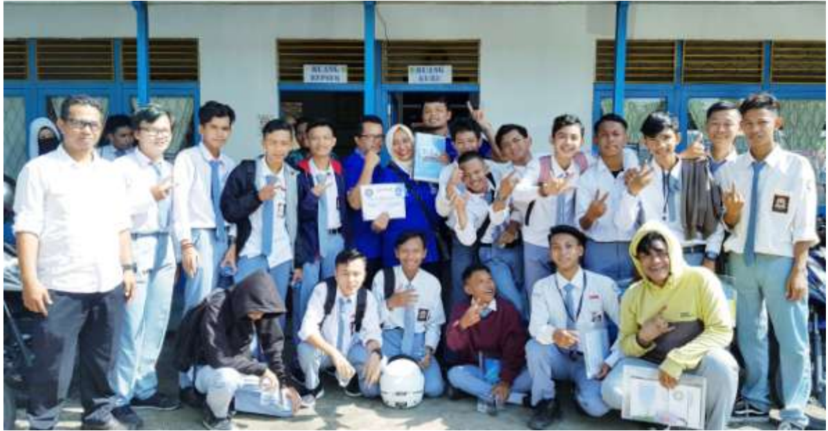
Gambar 9. Foto Bersama Peserta Kegiatan Pengabdian kepada Masyarakat