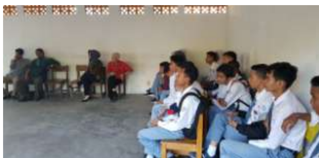
Gambar 8. Penyampaian Materi Meningkatkan Citra dan Nilai Tambah Sekolah SMK Mandiri Pontianak

Pelatihan pengembangan portal informasi sekolah SMK Mandiri Pontianak sangat disambut baik oleh seluruh warga sekolah. Motivasi yang ditunjukkan oleh para siswa dan para Guru menunjukkan bahwa warga sekolah ingin memanfaatkan teknologi informasi dan komunikasi dalam memperkenalkan sekolah ke masyarakat kota Pontianak secara khusus dan secara umum kepada masyarakat di provinsi Kalimantan Barat bahwa SMK Mandiri Pontianak juga memiliki prestasi baik pada bidang akademik namun juga pada bidang non-akademik. Para siswa ingin memanfaatkan sumberdaya sekolah yang dimiliki untuk menaikkan citra sekolah dimata masyarakat sekitar sampai pihak-pihak yang berwenang di dunia pendidikan, dengan demikian para siswa dan guru secara bersama-sama membuka peluang perolehan hibah dan bantuan dana sekolah.