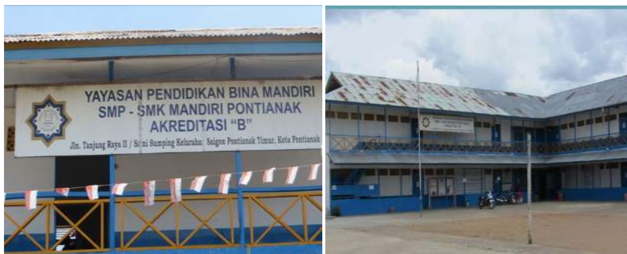
Gambar 3. Profile Gedung SMK Mandiri Pontianak

Jumlah Pendidik/Guru sebanyak 25 (dua puluh lima) orang dengan total jumlah siswa sebanyak 414 siswa yang terdiri atas 188 orang merupakan siswa laki-laki dan 226 orang siswa perempuan. Kurikulum yang dipergunakan adalah K13. Sarana dan prasarana yang dimiliki oleh sekolah terdiri atas ruang kelas yang tersedia sebanyak 18 (delapan belas) ruang kelas, 1 (satu) ruang Perpustakaan sekolah, dan 2 (dua) ruang sanitasi siswa. Laboratorium komputer yang tersedia adalah 1 (satu) ruang.