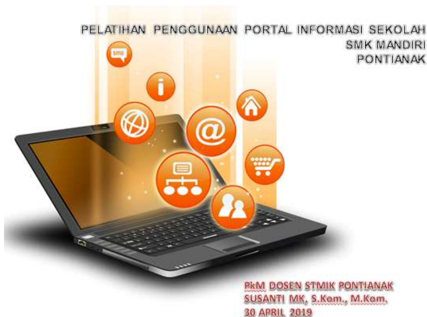
Gambar 7. Materi PkM

Sedangkan informasi tentang Guru yang mengajar di SMK Mandiri Pontianak terdiri atas 17 orang Guru tetap Yayasan dan 8 orang Guru Honorer sehingga dengan demikian terdapat 25 guru yang mengajar di sekolah tersebut. Memperhatikan informasi-informasi pokok dan penting yang dimiliki sekolah tersebut harus di simpan secara terpusat berserta dengan kegiatan-kegiatan proses belajar mengajar, kegiatan-kegiatan yang bersifat non-akademik harus di sampaikan kepada seluruh warga sekolah, orangtua/wali siswa, masyarakat umum maupun instansi diluar sekolah dan yayasan yang terkait dengan pendidikan di SMK Mandiri Pontianak melalui web portal informasi sekolah (Gb 7).